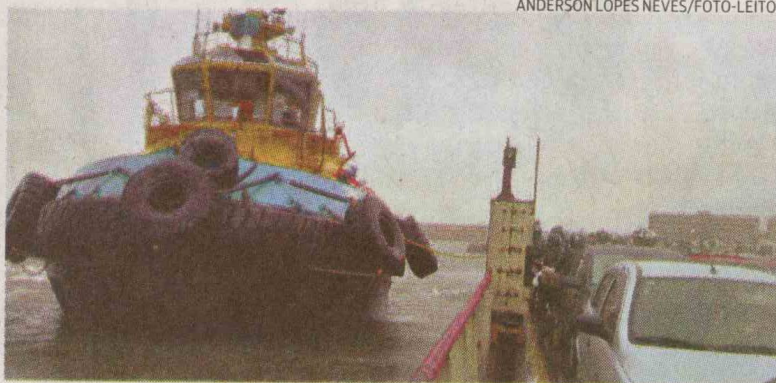
A balsa precisou da ajuda de um rebocador para atracar em Guarujá