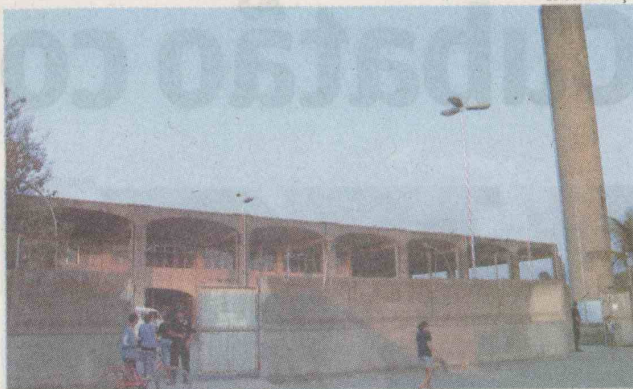
A unidade funcionará na Escola 1º de Maio, no Jardim Boa Esperança